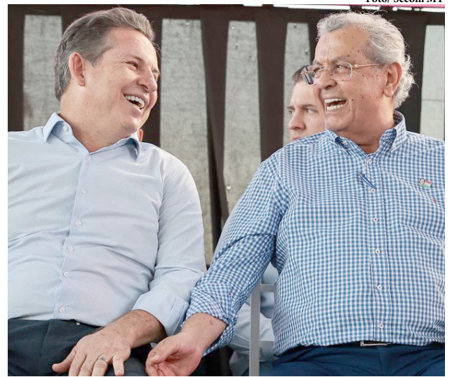
Governador Mauro Mendes e o senador Jayme Campos

Sobre a aliança com o PL, Mendes afirmou que existe sim uma conversa para uma repetição para uma aliança como ocorreu em 2022, mas que isso só ocorreria, caso o PL recusasse de uma candidatura pró-