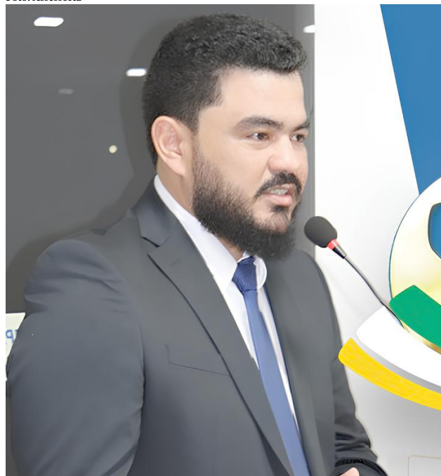
Presidente da Câmara diz que lei é ferramenta importante