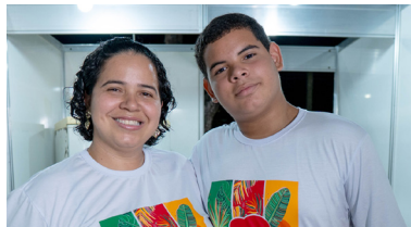
Delicias da Drikelly