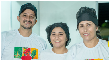
Garage Burger e BBQ