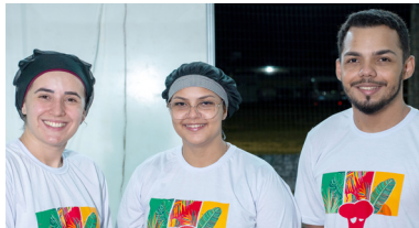
Comida de Mãe