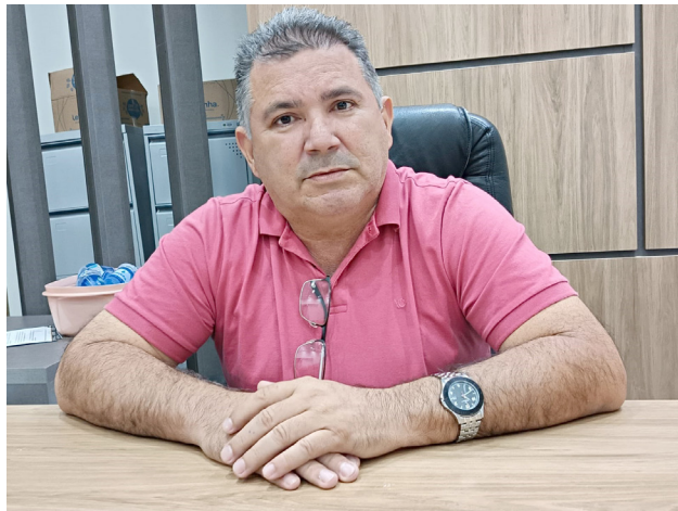
Presidente diz que medida é para ajuste à LRF

troladoria e o setor jurídico da Câmara. “Ela não foi uma decisão do dia para a noite. A gente teve que fazer esses cortes para que, em dezembro, a gente não ultrapasse esse limite”, reforçou.