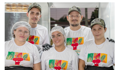
Mestre Gastro Bar