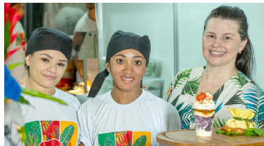
Frutos do Goias