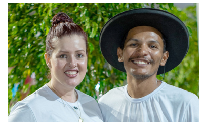
Fahenri Smoke House