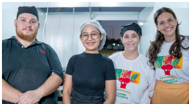
Crepe E Cia