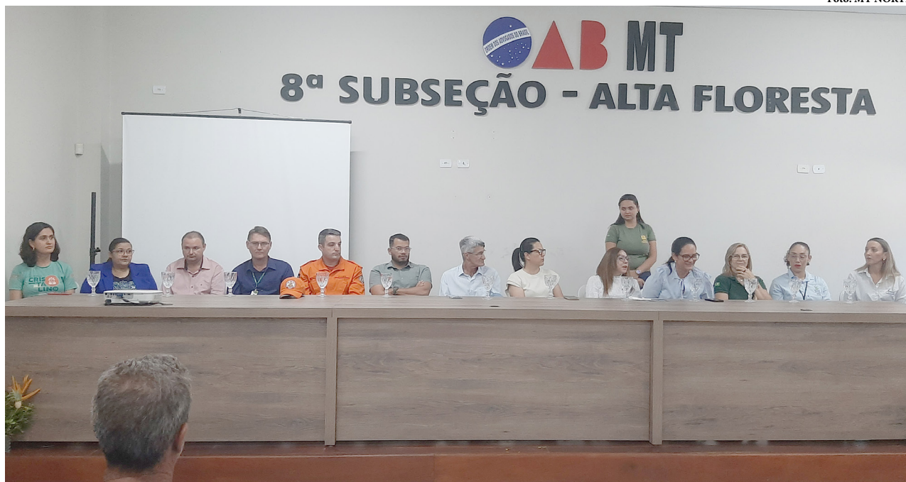
Campanha de prevenção às queimadas foi lançada nesta quinta-feira na sede da OAB

O evento contou com a presença de autoridades municipais, representantes de órgãos ambientais, lideranças comunitárias e parceiros da campanha. O lançamento marca o início de uma série de ações que irão mobilizar escolas, veículos de comunicação e a comunidade em geral, reforçando a importância da responsabilidade individual