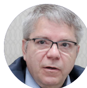
É professor e conselheiro independente certificado

Ignoravam — propositalmente ou por falta de compreensão — que alimentação e acolhimento eram partes indissociáveis de uma estratégia maior para manter crianças fora das ruas, protegidas da violência e com plenas condições de aprendizagem. O modelo então prevalecente, de até três turnos escolares de quatro horas cada,