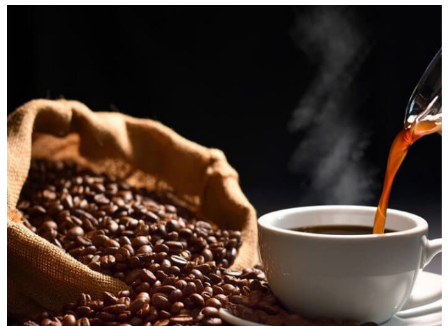
Exportações brasileiras de café estão em alta

Em terceiro lugar, destaca-se o café solúvel, com 4,15 milhões de sacas, representando cerca de 9,12% do total exportado dos Cafés do Brasil. O café brasileiro Torrado & Moído, com 56,86 mil sacas exportadas, compõe a totalidade das exportações da safra 2024-2025.