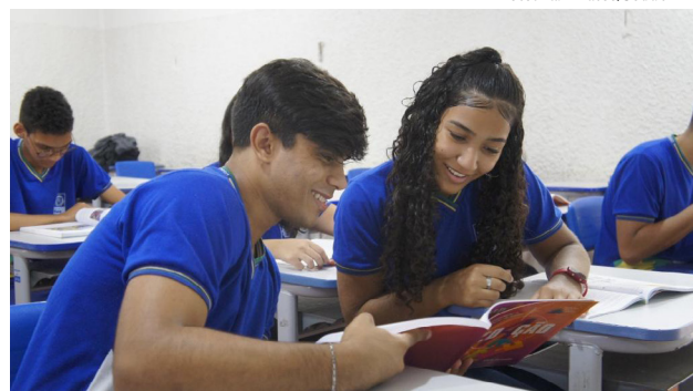
Meta da campanha é manter o aluno na Escola

A estratégia envolve identificação precoce de um possível abandono, acompanhamento individualizado, promoção da inclusão, engajamento da comunidade escolar e pre-