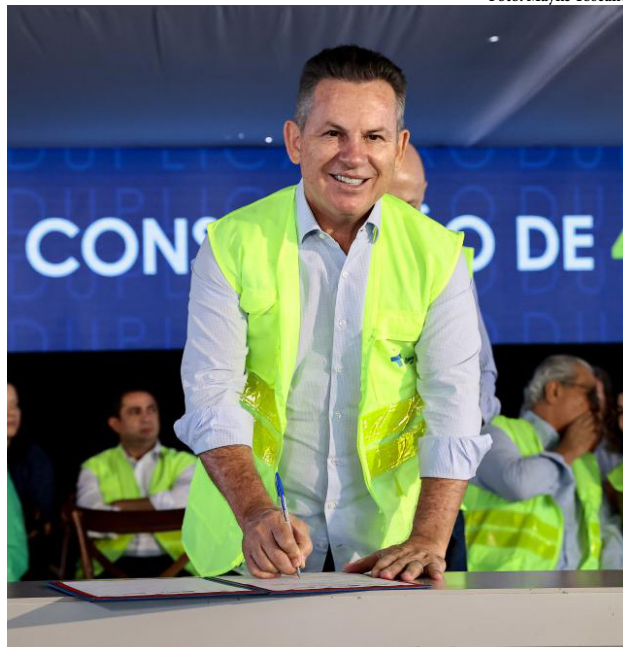
Mauro Mendes assina ordem de serviço para mais um trecho da BR-163

“É uma obra que transforma a realidade, que gera um potencial de crescimen-