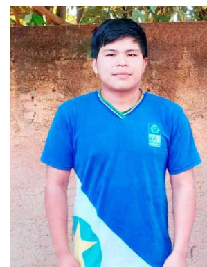
Aluno Perakopri Panará

O secretário de Estado de Educação, Alan Porto, ressaltou a importância da iniciativa para o futuro da juventude mato-grossense. “O intercâmbio proporciona aos nossos estudantes não apenas o aprendizado da língua, mas a vivência de novas culturas, o desen-