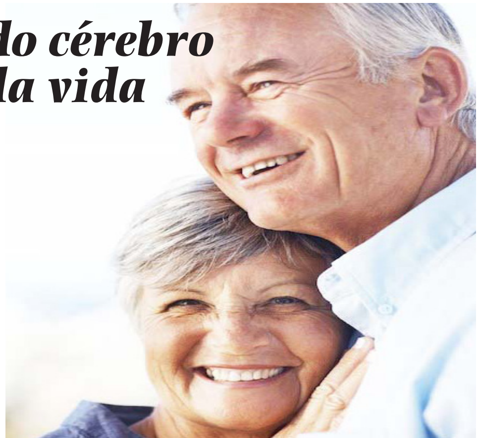
Atitudes em diferentes momentos da vida que influenciam a saúde cerebral e podem prevenir até 40% dos casos de demência, segundo estudos

“Um estudo clínico FIN-GER, conduzido com idosos em situação de risco (2015), demonstrou que a combinação de alimentação saudável, exercícios, treino cognitivo e controle clínico reduziu em até 30% o declínio cognitivo em apenas dois anos de acompanhamento.