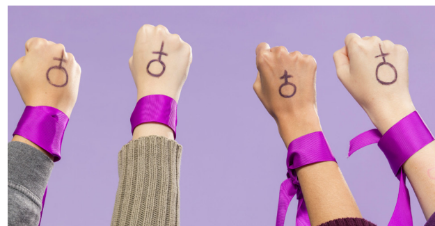
Temas em debates serão sobre os direitos da mulher

As inscrições são gratuitas e poderão ser feitas diretamente no local do evento. A programação inclui momentos de diálogo e debates organizados por eixos temá-