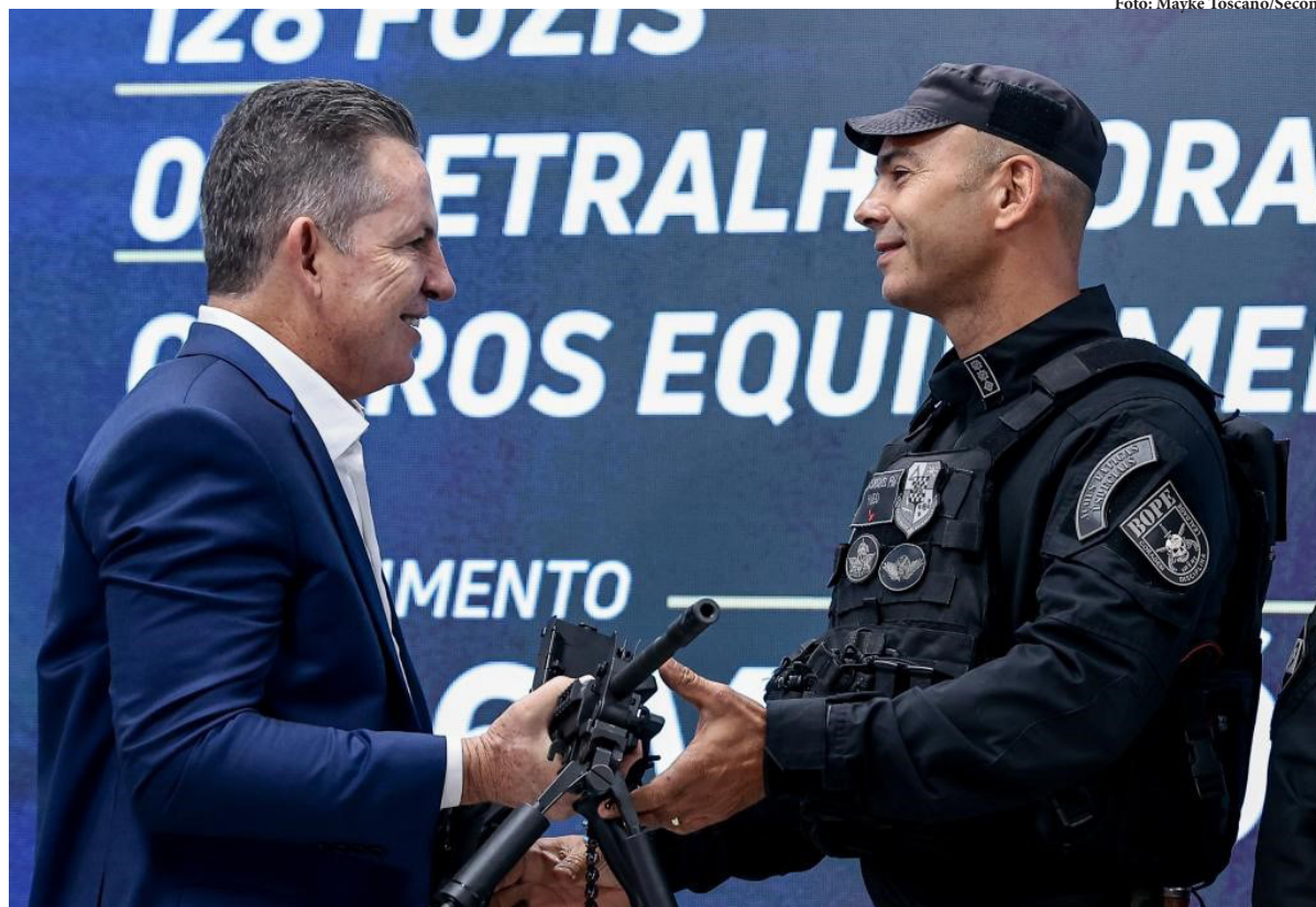
O governador Mauro Mendes, durante evento de entrega de armamentos

Mauro Mendes entregou 128 fuzis da marca israelense IWI, metralhadoras Negev e armas de eletrochoque Taser X2, óculos de visão noturna, miras optrônicas, e outros equipamentos tecnológicos. PÁGINA 11