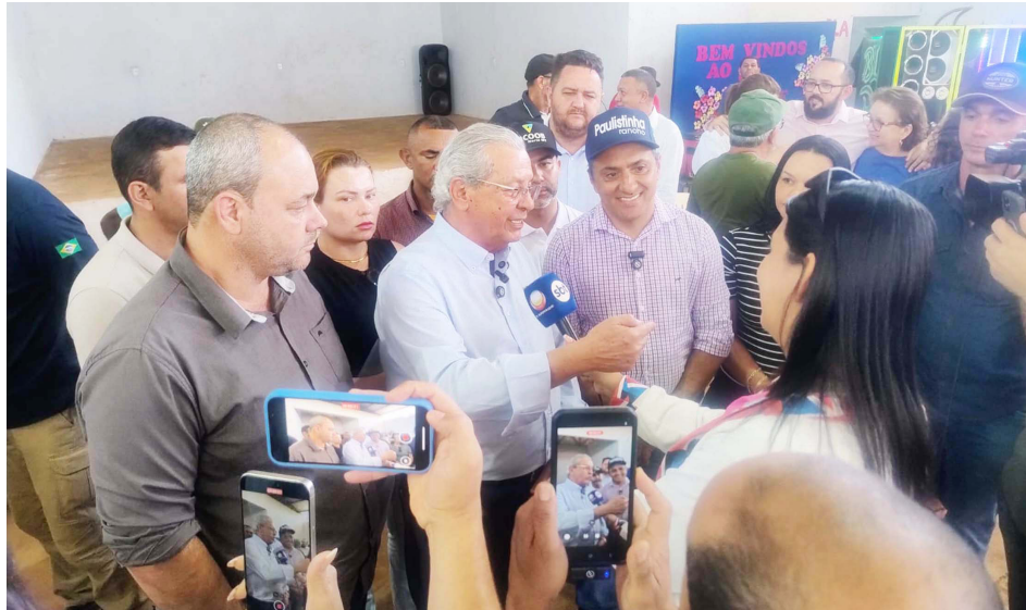
Senador Jayme Campos visitou o distrito União do Norte no final de semana

ram direto para União do Norte e puderam ver de perto as transformações que estão acontecendo e as ações do senador que estão sendo executadas para melhorar a qualidade de vida dos moradores do distrito, como pavimentação asfáltica e antena de transmissão de sinal de telefonia, dentre outros investimentos.