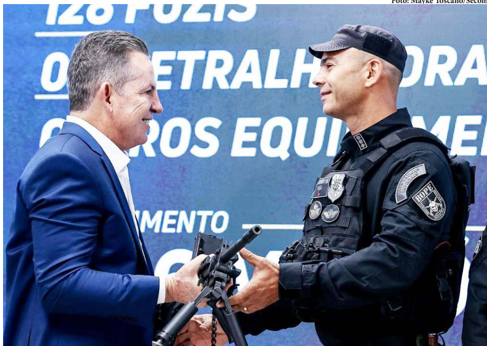
O governador Mauro Mendes, durante evento de entrega de armamentos