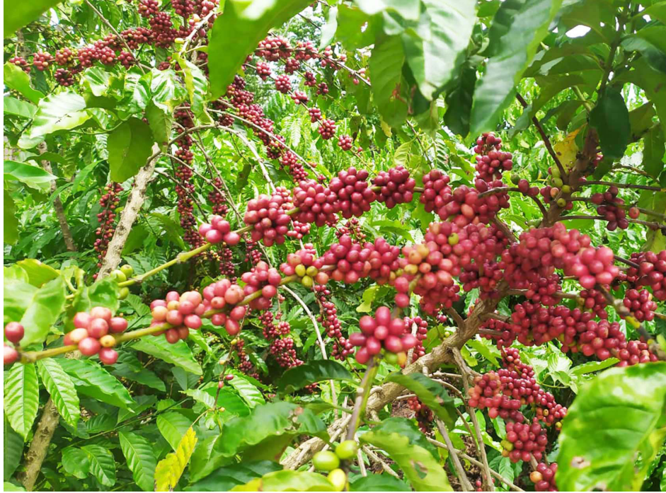
Produção de café no município de Alta Floresta está em crescimento

EM 2024, O MUNICÍPIO BATEU RECORDE: FORAM MAIS DE 90 MIL QUILOS COLHIDOS