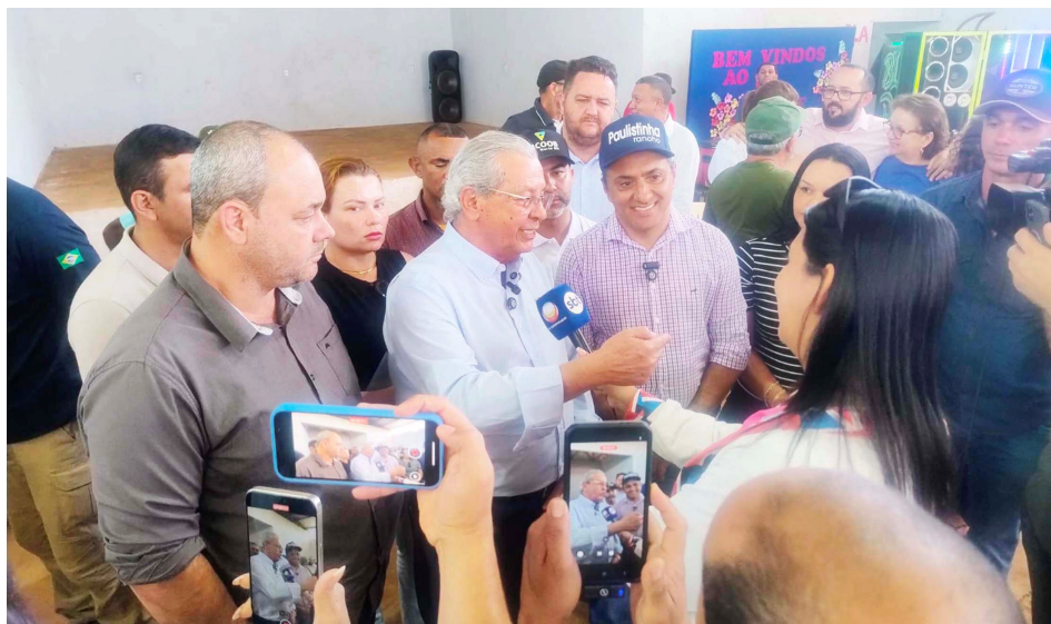
Senador Jayme Campos visitou o distrito União do Norte no final de semana

ram direto para União do Norte e puderam ver de perto as transformações que estão acontecendo e as ações do senador que estão sendo executadas para melhorar a qualidade de vida dos moradores do distrito, como pavimentação asfáltica e antena de transmissão de sinal de telefonia, dentre outros investimentos.