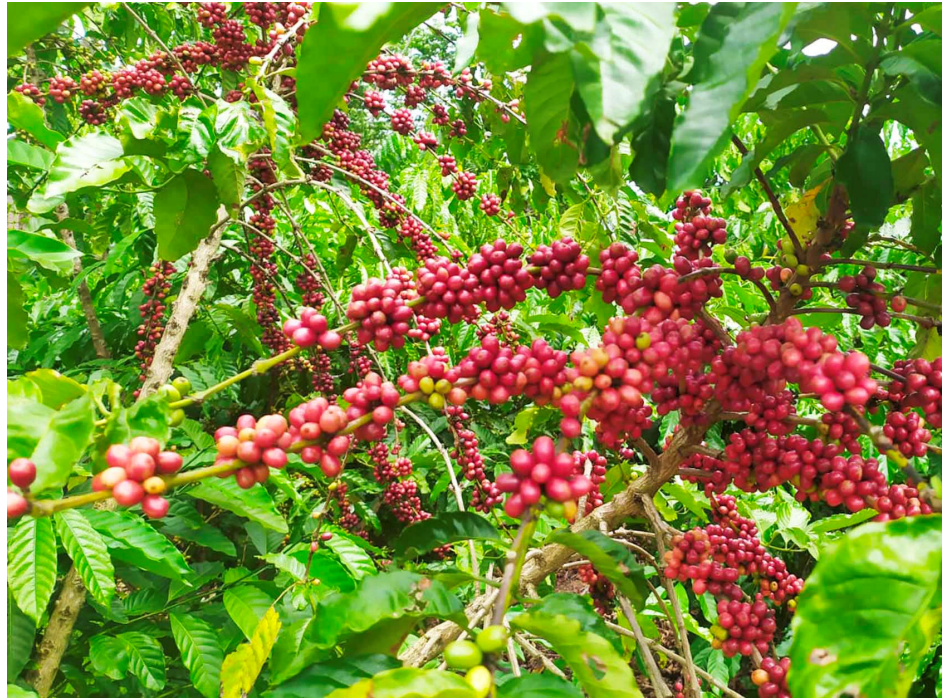
Produção de café no município de Alta Floresta está em crescimento

EM 2024, MUNICÍPIO BATEU RECORDE: FORAM MAIS DE 90 MIL QUILOS S